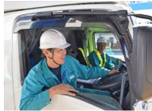
運行業務体験の様子

運行中乗務員の方とたくさんお話をしたのだとか！残念ながら詳しい内容は聞くことが出来ませんでした・・・